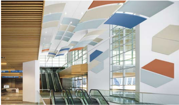
Marquises SoundScapes en pluie, bruine, topaze, gris clair et blanc