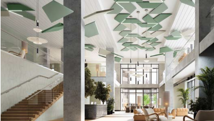
Formes SoundScapes en fougère, buis et gris clair